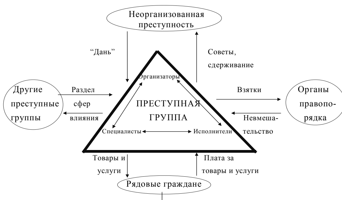
Рис. 1. Система неформальных контрактов преступной организации

антиобщественными остродефицитных потребностей рядовых граждан. Организованная преступная группа интерпретирована как система неформальных (негласных) отношенческих контрактов, минимизирующих транзакционные издержки преступной деятельности (Рис. 1). Помимо функций фирмы мафия может выполнять функции государства. Ведь, занимаясь рэкетом, преступная организация продает услуги по защите прав собственности. Правоохранительные услуги всегда относят к числу общественных благ, производство которых монополизировало государство. Поэтому развитие рэкет-бизнес следует рассматривать как форму криминального политогенеза, создания теневого эрзац-правительства, конкурирующего с официальным правительством. Наконец, преступные организации имеют многие черты домохозяйств, когда внутри криминальной группы культивируются альтруистические взаимоотношения без ожидания наград, по типу отношений в архаичных общинах.